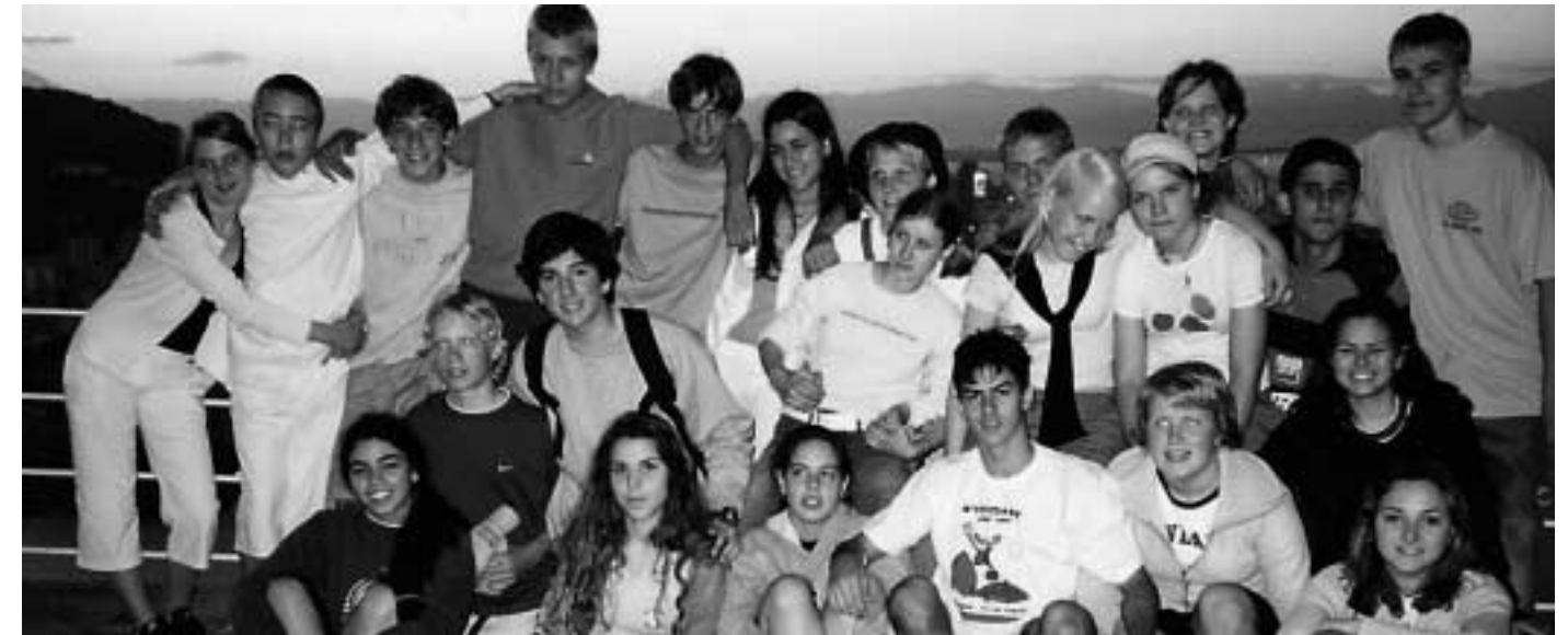
RIO 2003. Auringon laskussa Sugar Loaf:lla eli sokeritoppavuoren upeissa maisemissa