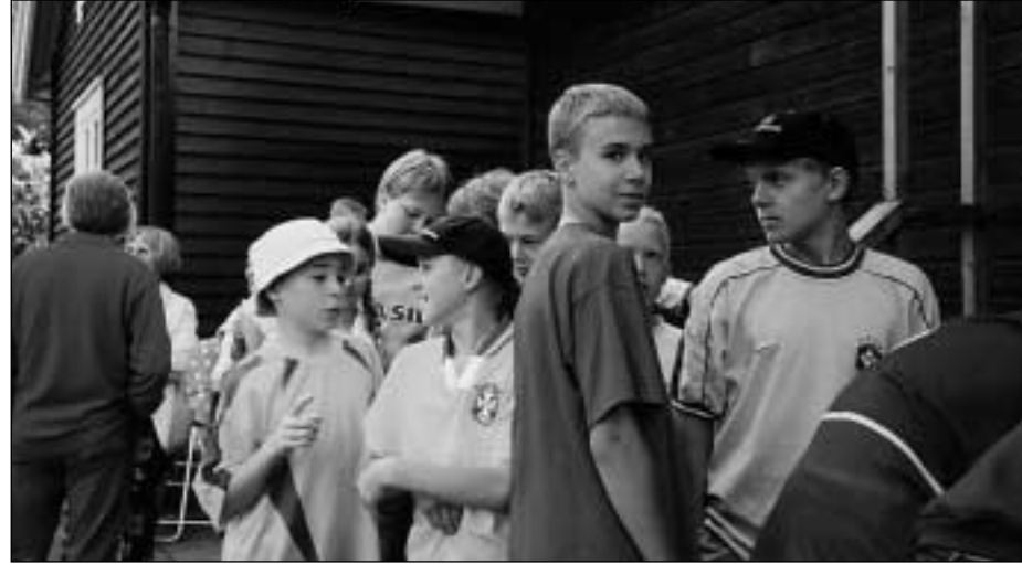
Helsinki 2002. Tervetulojuhlassa beti Brasilian MM-kullan jälkeen