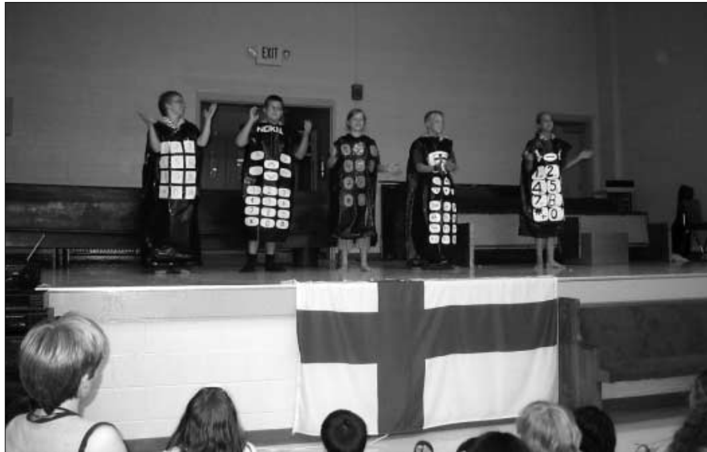
Suomalainen Nokia tuli tunnetuksi kännykkätanssistamme, jota säesti ABBA:n Ring Ring -biisi. Esityksemme jälkeen asut lähes revittiin päältämme ja monet halusivat esittää tanssia vielä pitkään jälkeenkin päin...

Matkamme alkoi hyvin tehokkaasti ja nopeasti, koska saimme delegaatiomme kokoon vasta 2,5 viikkoa ennen lähtöä! Ehdimme nähdä toisiamme vain kerran ennakkoon ja siitäkin ajasta Kiti-ohjaajamme täytti kaiken maailman kaavakkeita vanhempiemme kanssa. Matkaan kuitenkin päästiin, mutta ensimmäinen ongelma ilmeni Brysselin kentällä, missä meillä oli aikaa vaihtaa konetta vain 80 minuuttia. Tietenkin jouduimme kävelemään kentän toisesta päästä toiseen, jolloin siihen uhrautui 40 minuuttia. Kun sitten vihdoinkin ja viimein olimme päässeet tulliin asti, jouduimme vielä erikoissyyniin, koska leaderimme ei ollut meidän