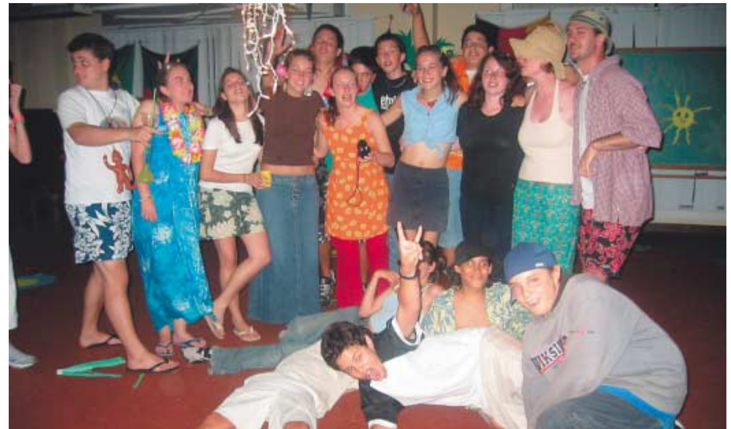
Hauskaakin pidettiin, tässä otos nuorten suunnittelema "Beach-party" iltaktiviteetistä.