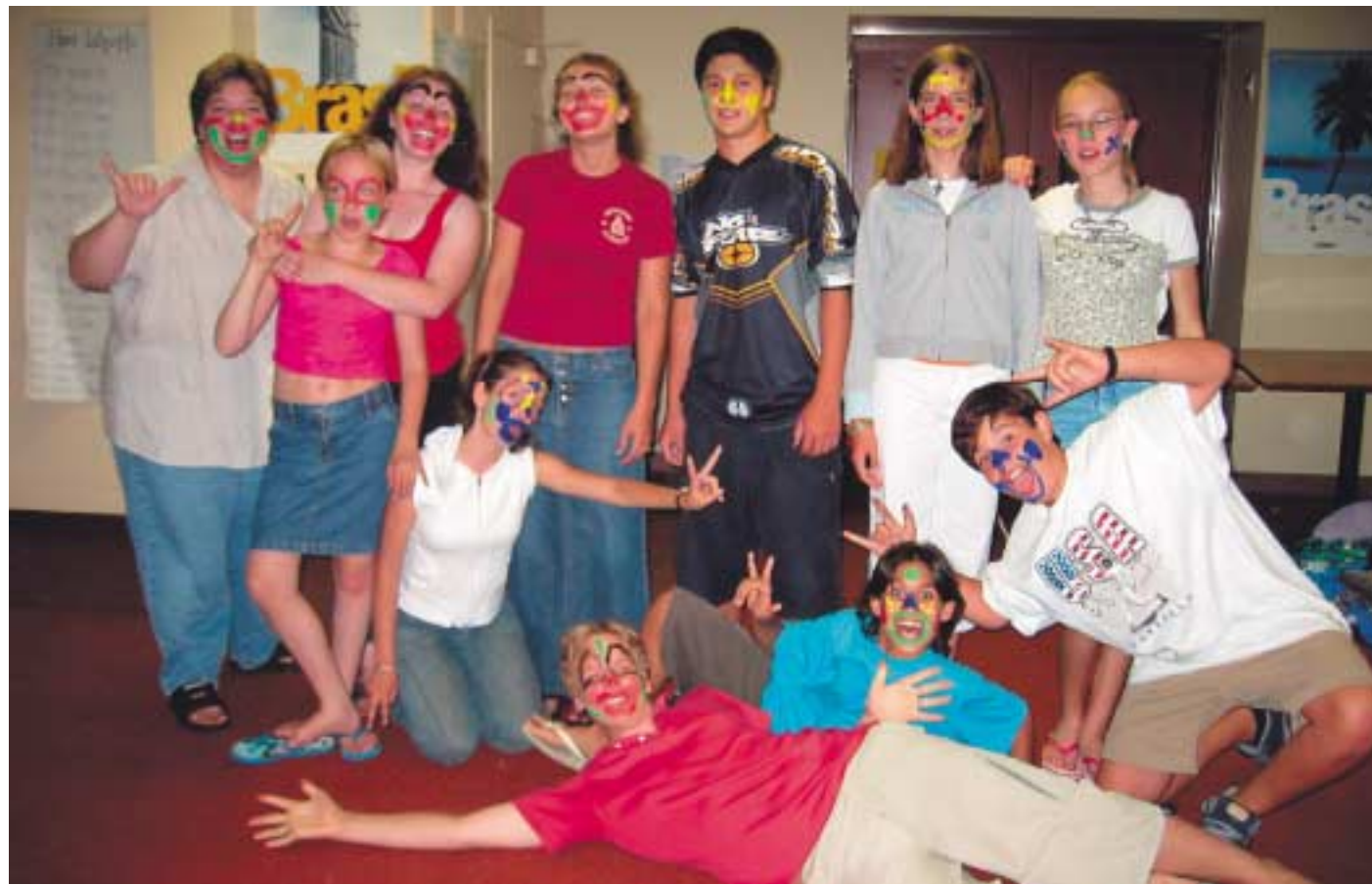
Nuoret suunnittelivat omat aktiviteetit, ja niistä tulikin usein todella hauskoja. Monet niistä liittyivät ryhmätyöskentelyyn ja tässä ryhmä pelletä toiminassa.