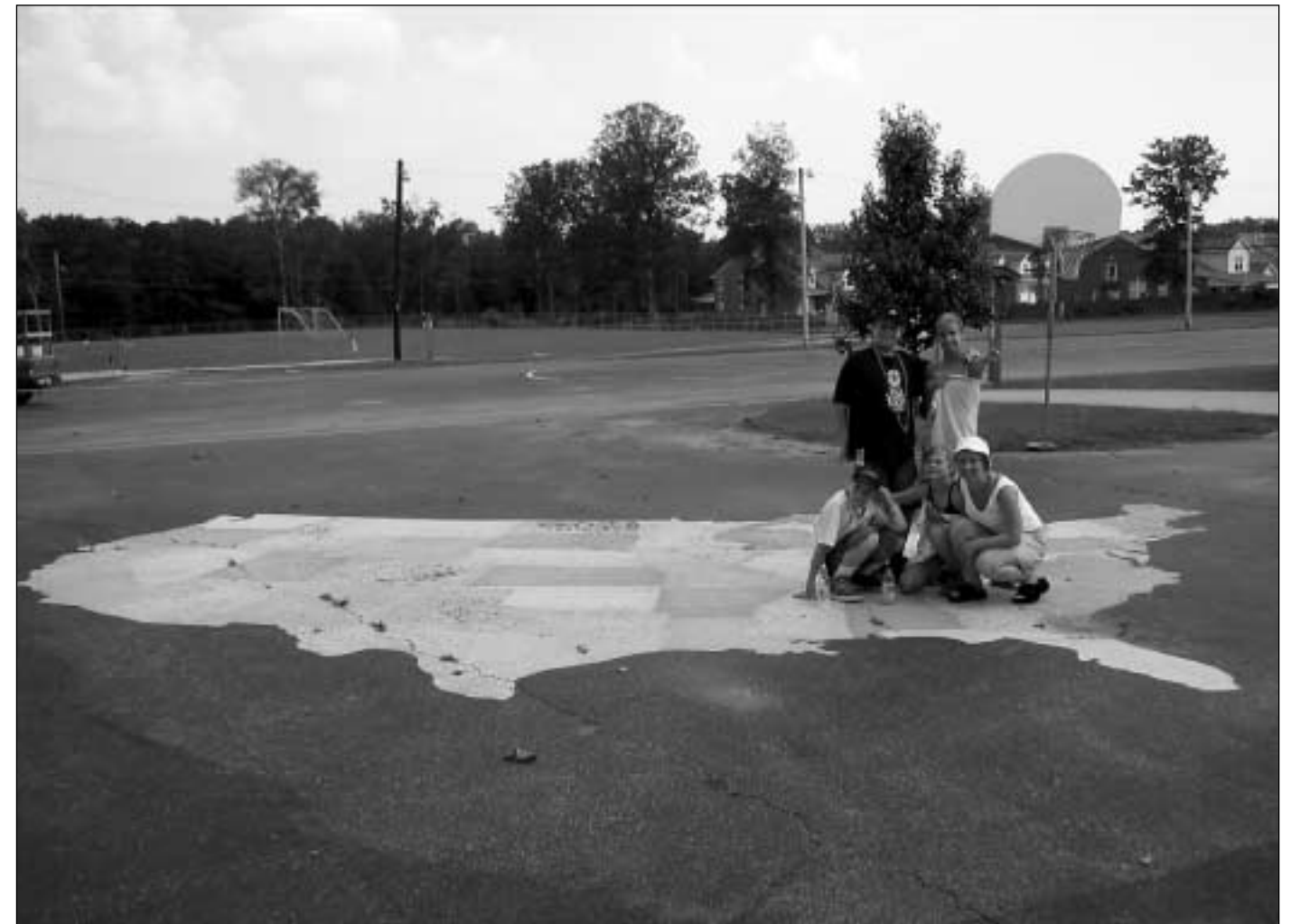
Löysimme uima-altaan kupeesta ison hienon USA:n kartan, josta etsimme heti Tennesseeen osavaltion ja ...click!