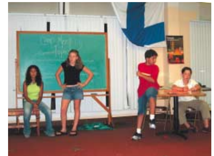
Camp Meeting jota veti nuorista kaksi äänestyksellä valittua puheenjohtajaa ja apunaan kaksi sihteeriä. Vakavat ilmeet kuvastavat sitä, että leirin parantamiseen subtauduttiin vakavasti.