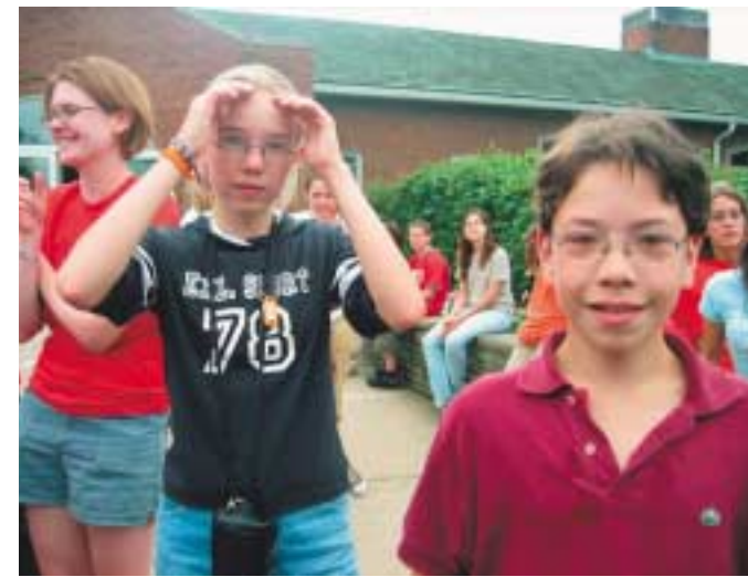
Viimeisenä päivänä oli pakko hyvästellä uudet ystävät.