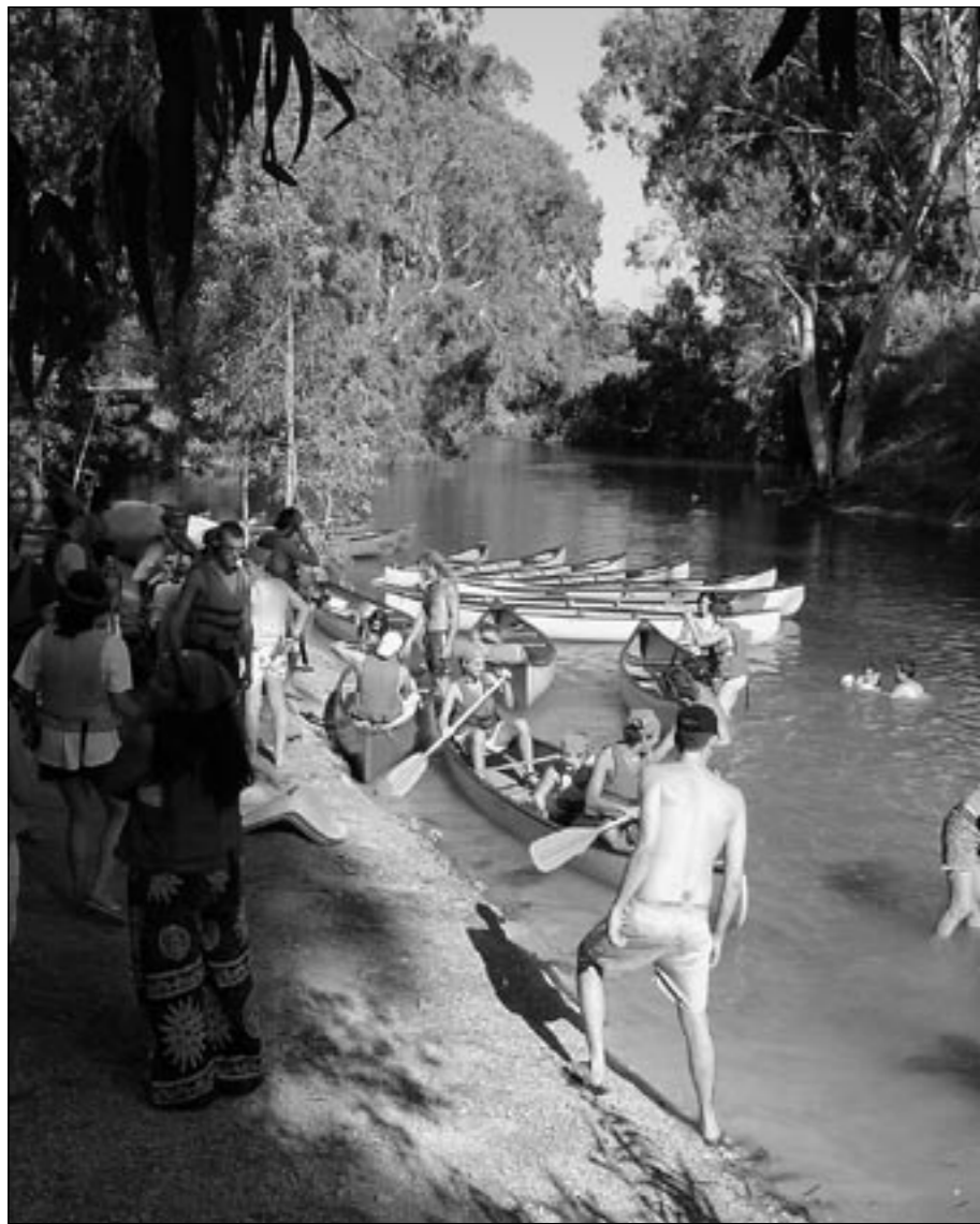
Lähdössä melontaretkelle Jordan joelle.

Jälleen koottiin yhteen, saman katon alle kaikki maailman juniorit, 15-25v. Tällä kertaa oli Israelin vuoro näyttää millaisen tapaamisen he saavat järjestettyä. Puitteiden ollessa Genesaret-järven rannalla mitä mahtavimmat, oli lähtökohta hyvälle tapahtumalle mitä parhain. Vaikka lämpömittari näytti lähemmäs 40 astetta, olimme valmiit ahkeraan työntekoon.