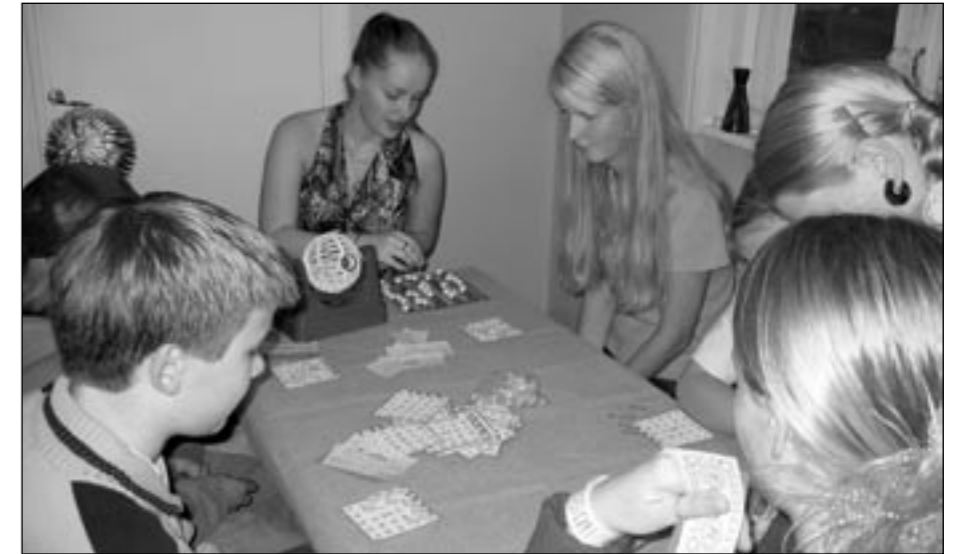
Kuvassa Nuorten järjestämä Casino jossa toimi myös Bingo-lotto

Tämän jälkeen saimme tervehdyksen maailmalta. Porvoolainen delegaatio, joka oli viettänyt kesällä kuukauden El Salvadorissa, leikitti yleisöä espanjankielisellä lau-