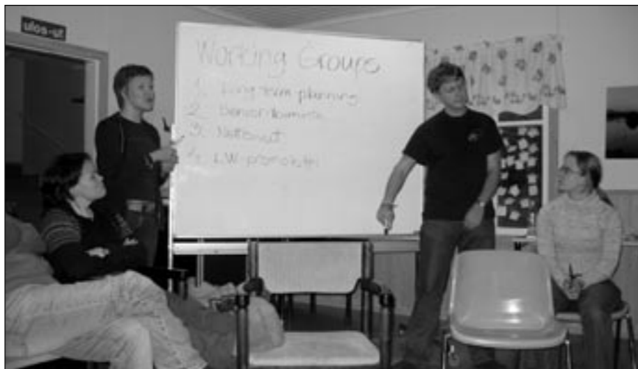
Työryhmien aiheita pohdiskellessamme käytimme myös taulua hyväksemme.