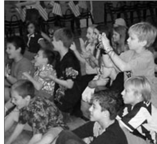
USA vs. Kanada sukka-lusikka-jääkiekkomatsin katsomo.