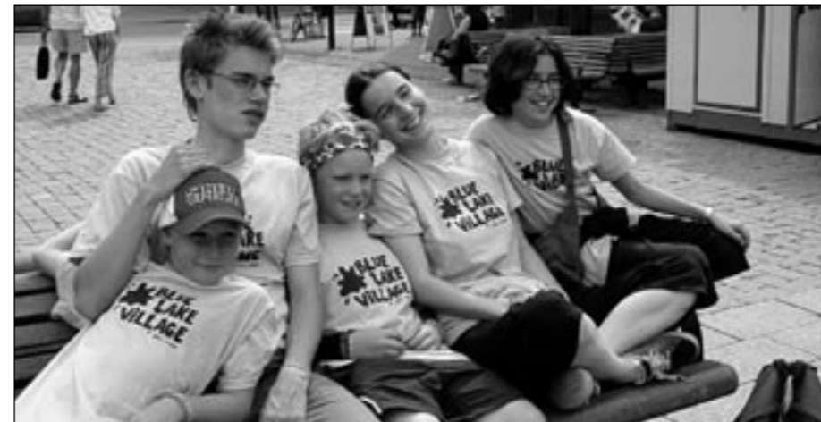
Lappeenrantalaiset saivat shoppingdayna ihmetystä osakseen, kun kaupungin kadut täyttivät vaaleansinipaitaiset cisviläiset.