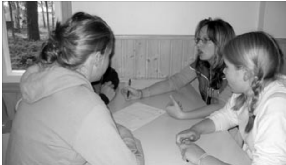
Ahkerat toverukset puurtavat uutta ja loisteliasta aktiiviteettia kasaan.