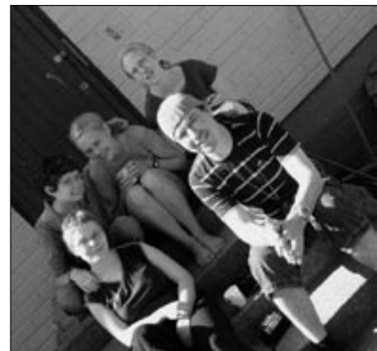
Meidän Staffi viettämässä Leaders Weekendä.

Kaikenkaikkiaan järjestön aktiiviteetteihin on osallistunut jo yli 150 000 osallistujaa yli sadasta maasta.