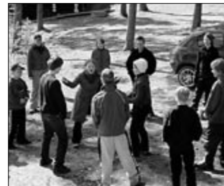
Samurai intergalacticon loppuhuijennus.

Kesäaikaan lukuun ottamatta jotain tapahtuu Lappeenrannan paikallistoiminnassa joka kuukausi. Viime viikonloppuna myö oltiin joka syksyllä paikallisleirillä Asinsaaren leirikeskuksessa, tai tuttavallisemmin Asiksessa, aktiviteettien, ruoan, saunan ja CISV-laulujen merkeissä. Ilma oli kylmä, mutta aurinko paistoi kauniisti. Myös Asinsaaren erinomainen sauna lämmitti mukavasti. Paitsi syksyisin, Asiksessa leireillään myös keväisin. Yleensä myö kuitenkin kokoonnutaan kerran kuukaudessa lasten ja nuorten kanssa kerhoiltopäivään. Kerhoiltopäivissä on erilaisia CISV-leikkejä ja pieniä keskusteluja, ollaanpa joskus kokattukin jotain pientä. Haluaisitko siekin olla myö?