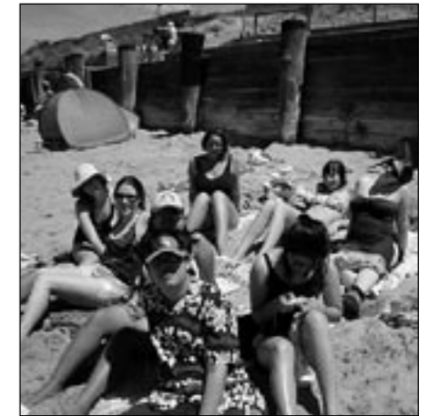
Eihän sitä aina jaksaa olla leiripaikalla.. ja on se ihan kiva makoilla rantsussa joulukuussa.