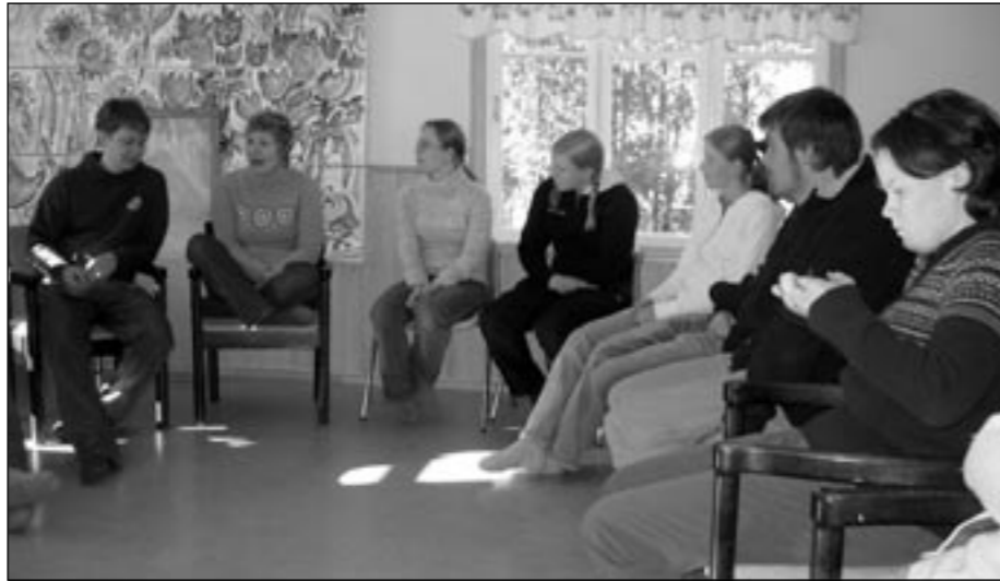
Tässä kuvassa tutustumisleikkejä heti saavuttuamme.

Vielä muutama sananen niille, jotka eivät päässeet tänä vuonna mukaan. Vaikka tämä viikonloppu kantaa nimeä koulutus viikonloppu, on tämä tehty niin mielenkiintoiseksi ja mukavaksi, ettei sitä tavanomaiseksi koulutukseksi voi laskea. Eli kaikki kynnelle kykenevät mukaan ensi kerralla.