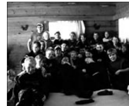
Koko Asiksen mahtitiimi keväällä 2004.

Tule ihmeessä mukaan Lappeenrannan paikallistoimintaan! www.fi.cisv.org/lappeenranta