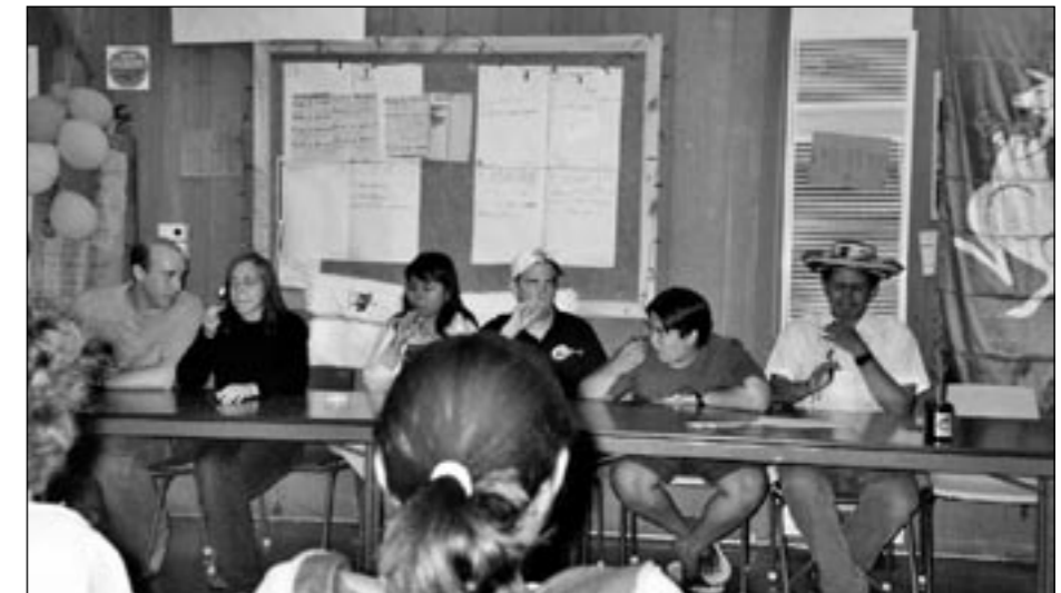
Kaikkihan rakastavat Vegemiteä, eikö totta?! Mutta kuka jaksakaan syödä eniten?