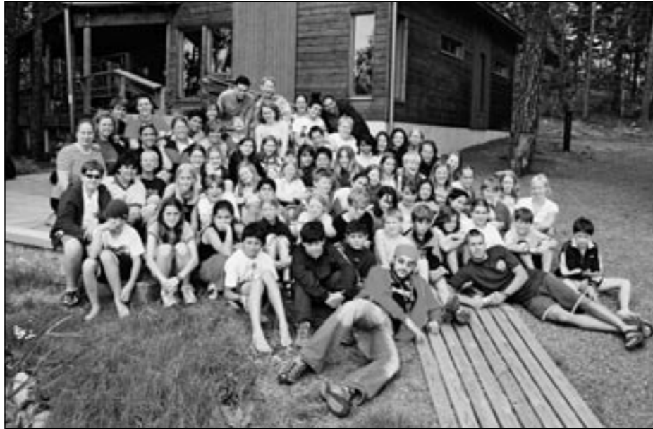
Koko leirin väki ryhmäkuvassa Soiniemen saunaretkellä