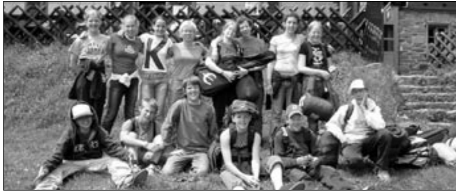
Meidän ja Itävallan delegaatio 1500 m:n korkeudessa minicampilla.

Lentokentältä jokainen suuntasi oman isäntäperheensä luo ja viimeistään silloin jokainen ymmärsi olevansa vieraassa maassa. Ensimmäisten päivien aikana monella oli pääköppä kipeänä valtavasta päänsisäisestä käännösrumbasta, mutta asiat saatiin selviksi ainakin viimeistään elekielen avulla. Ja voi sitä pälätystä ja pölötystä, kun näimme jälleen toisemme welcome-partyissa parin päivän kuluttua saapumisestamme! Muutamat olivat käyneet ”isäntiensä” ja ”emäntiensä” kanssa heidän koulussaan, sillä wieniläisillä lapsilla loppui koulu vasta heinäkuun alussa! Yksi oli uinut isäntäperheensä uima-altaassa, toinen taas pelannut ”pleikkaria” kokonaisen päivän. Kaikilla tuntui olevan hauskaa, mikä oli tietenkin